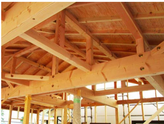
棟上げまで一気に組み立てます。屋根裏の骨組みの様子がよくわかります。