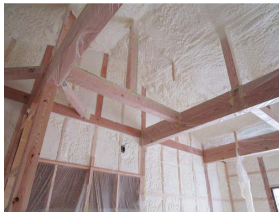
硬質ウレタンフォームを吹き付け、天井・壁・床下にすき間なくきれいに断熱材が入りました。