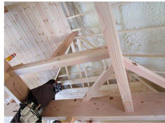
天井を無垢材で板張りしています。複雑な形状に板を張る作業は大工の腕の見せ所です。