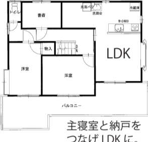
主寝室と納戸をつなげLDKに。