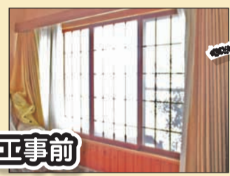
佐久市 S様邸 居間の大きな腰窓

ぽかぽか暖かいはずの縁側ですが、単板ガラスのアルミサッシで冬場は寒く、結露もひどい状態でした。。ペアガラスの内窓設置で暖房器具の効きも良くなり、エコにもなりました。環境にもお財布にも優しく、家の中もぽかぽか。ペアガラスに窓枠が樹脂製ですので、室内側に冷気が伝わりにくいので、窓周りの結露もかなり軽減されました。大きな窓でも1日で設置可能です。(納まりによって木枠の設置が必要になる場合には工期が延びる場合がございます)