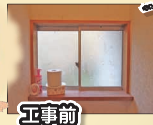
トイレの小窓にも設置

ペアガラスの内窓を設置。普段滞在時間の長い居室や水回りなど、寒さが特に気になる場所の設置がお勧めです。窓枠の色も数種類から選べますので、お部屋の印象もアップデートできます。