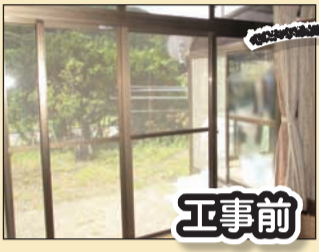
佐久市 S様邸 縁側の掃出し窓