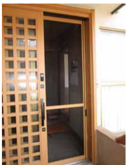
網戸が付けられます

玄関引戸のガラスが割れてしまった事をきっかけに、高断熱玄関引戸に交換されました。ガラス面が多いサッシは防犯性が低く、単板ガラスは断熱性が低いので冬期は結露などの原因にもなります。