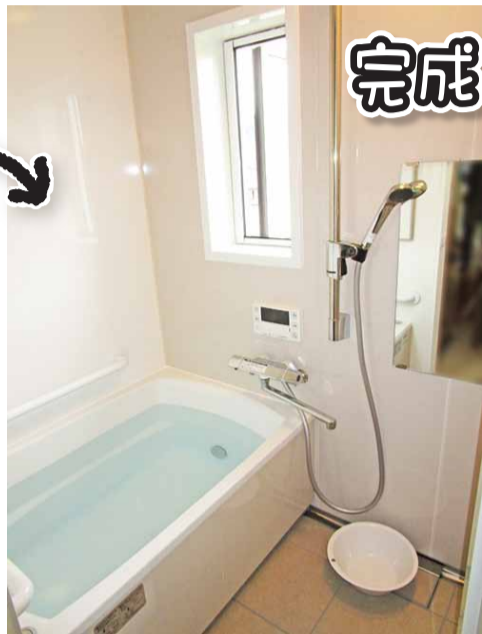
Takara standard ぴったりサイズシステムバス

・天井が斜め・太い柱が邪魔している場所なので新しくしても狭くなる？ ・既存の浴室がとても狭いので、同じ場所にシステムバスは入れられる？ そんなお宅の浴室リフォームにはこれ！ 今ある浴室空間、お部屋の出っ張り、などを無駄なく広く設置できる、『ぴったりサイズシステムバス』がいいですよ♪ スペースでお悩みのお宅は、お気軽にご相談下さいませ。