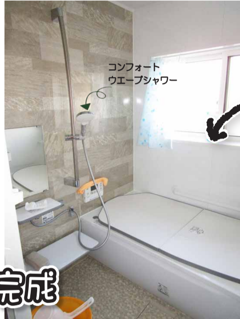
TOTO システムバスルーム Sazana