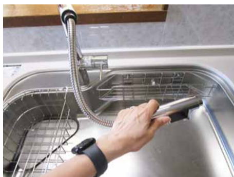
シンクの水栓はシャワーの様に伸ばせるので、隅々まで洗い流せてとっても便利で清潔に!