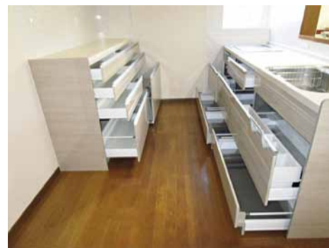
大容量の収納スペース。 ※全部開けてみました。大きなお鍋や、桶なんかも入っちゃう程です。