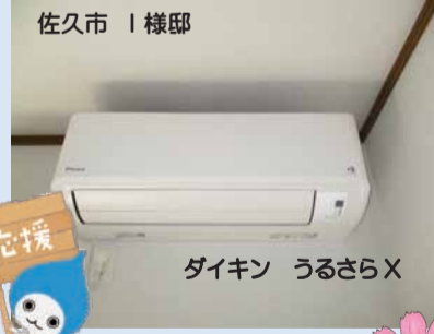
ダイキン うるさらX