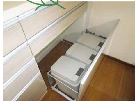
ゴミ入れは隠せる収納で、見た目もスッキリ!