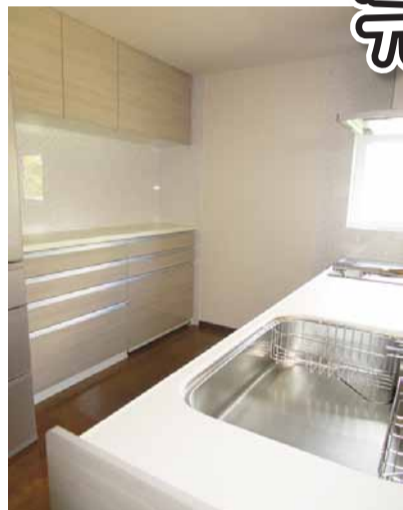
カップボードには吊り戸棚も設置しました。これだけの大容量収納スペースがあれば、お片付けもスッキリとできそうです!