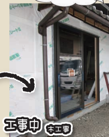
工事中 木工事 外壁・サッシ周りは、防水シートやテープをしっかり貼ります。