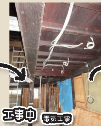
工事中 電気工事 天井や壁を張る前に、電気の配線工事が入ります。