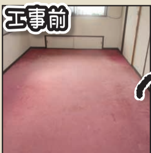
工事前 カーペット→合板フローリング 合板フローリングは傷に強く、汚れが付きにくく、カラーも豊富に選べ、統一感ある仕上がりになります。