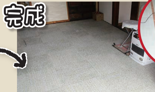
完成 佐久市 K様邸