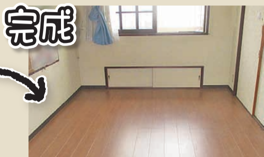
完成 佐久市 S様邸