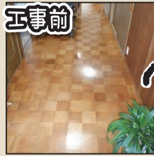
工事前 合板フローリング→合板フローリング 昔流行った、市松柄のフローリングは経年劣化で傷んでおりました。断熱改修し、新しい合板フローリングに張り替えました。