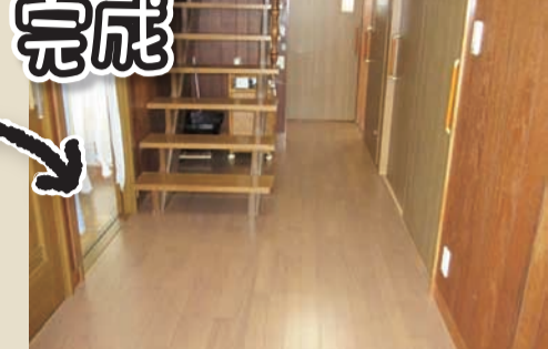
完成 小諸市 T様邸