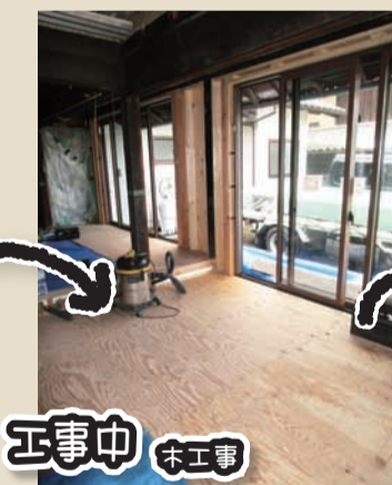
工事中 木工事 大工が外窓・勝手口などサッシを設置していきます。