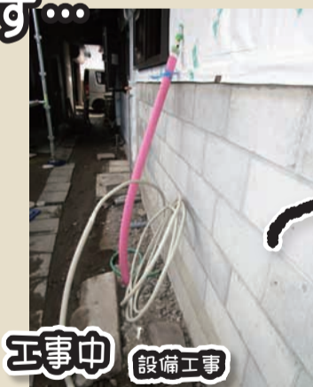
工事中 設備工事 設備の配管は、床などを張る前にそれぞれの器具設置場所に回しておきます。