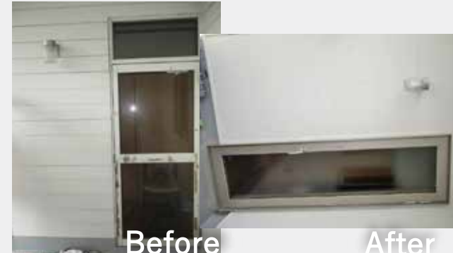
廊下出入口 | テラスドア交換

廊下から屋外の物干しスペースへ出入りするテラスドアを交換しました。横引きロール式の網戸も設置し、風通しと断熱性がさらに向上しています。