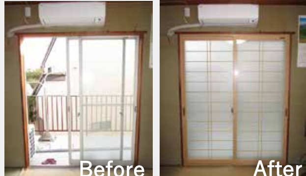
和室 | 内窓設置

和室の冷え込み対策として、和紙のような風合いの格子入り内窓を設置しました。格子はガラスの内側にあるため、細かい棧のお掃除の手間もかかりません。