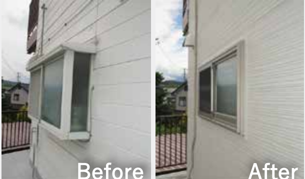
キッチン | 出窓交換

キッチンの出窓は結露が多く、奥まっけて開閉しにくい状態でした。高断熱窓へ交換することで、使いやすさが向上し、断熱性の改善も期待できます。